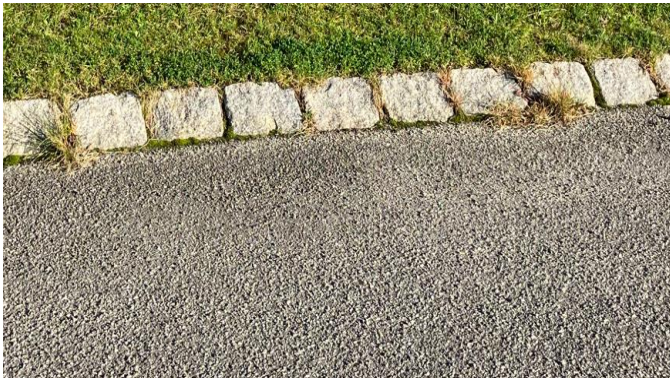
Billede 5: Ukrudt i kanten af vejen

Ukrudt der vokser i rabatten og i vejen er også med til at nedbryde vejen da det ødelægger belægningen og dermed kommer der huller i vejen, så der kan komme vand ned i belægningen og ned til de underliggende lag. Det er en god ide at sørge for at holde ukrudt væk fra belægningen.