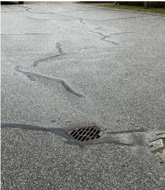
Billede 1: Revneforsegling på sidevej på Østerløkken.

På Blomstervænget, Østervænget og stierne er der ikke konstateret nogen skader. Det generelle skadesbillede på Østermarken og Østerløkken er, at der er mindre revner. Når der er en revne i oversiden af belægningen, så går den hele vejen ned igennem asfaltbelægningen. Når det regner på vejene, vil vandet via revnerne søge ned i de ubundne bærelag og dermed svække hele belægningen. På alle vejen er mange af revnerne blevet forseglet. Der er et specielt på Østerløkken der er lavet meget revneforsegling. På stamvejen Østermarksvej er midtersamlingen revnet og den vil kræve en større reparation. Selv om revnerne er blevet udbedret vil de desværre som regel komme igen i et nyt lag asfalt. Revnerne kan komme hurtigt eller der kan gå flere år.