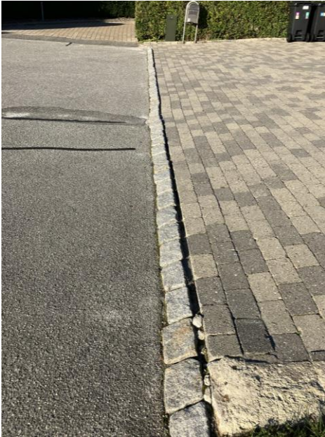
Billede 7: Brosten brugt som kantsafslutning ved indkørsler og langs rabatter.

Det blev ved gennemgangen af strækningerne konstateret brosten der er brugt som afslutning af vejarealet. På efterfølgende billede kan det ses hvorledes der ligger brosten som kantsafslutning og som ramper ved indkørsler. Ved udlægning af nyt asfalt skal man være opmærksom på det nye lag kommer til at lægge op på brostenene, ca. 2,5-3 cm.