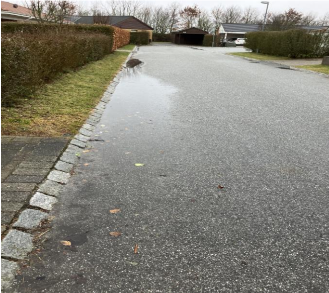
Billede 3: Vandlunke på Østermarksvej nr. 14-30

Der er nogle steder konstateret at der står vand på vejen. Det er ikke godt for vejen at vandet ikke kan løbe væk. Det er noget af det der er med til at nedbryde vejen.