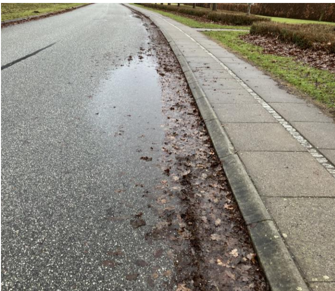
Billede 4: Mange blade samlet i rendestensarealet på Østermarksvej.

På specielt stamvejen Østermarksvej er der observeret mange blade i rendestensarealet. Ulempen ved dette er at vandet ikke kan løbe i afvandingsristene og dermed er det med til at nedbryde belægningen og de underliggende bærelag.