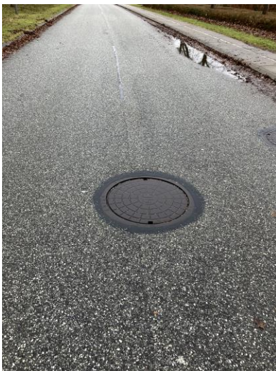
Billede 6: Dæksel på Østermarksvej der ligger for lavt.

Det generelle billede omkring vejafvandingsbrønde på strækningerne er, at der ikke er observeret nogen steder der potentielt kan indikere at der er problemer med afvandingsystemet (Defekte brønde & stikledninger). Dog er der på Østermarksvej observeret nogle dæksler der ligger for lavt og det ser ud til at pakningen i dækslet er ødelagt. Det anbefales at kontakte forsyningen da det er deres ledninger og dæksler der ligger i vejen. Hvis pakningen er ødelagt vil dækslet ligge løst og "larme eller klapre" når man kører over det.